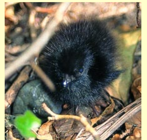
Dva dni star mladič kosca.